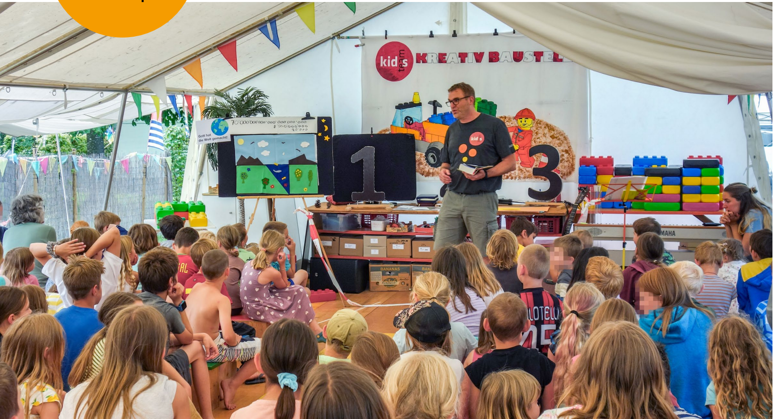
damit Kinder ihr Vertrauen auf Gott setzen!