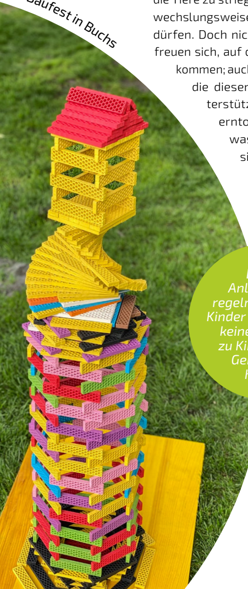
Baufest in Buchs

Dieser Anlass zieht regelmässig viele Kinder an, die sonst keinen Kontakt zu Kirchen oder Gemeinden haben.