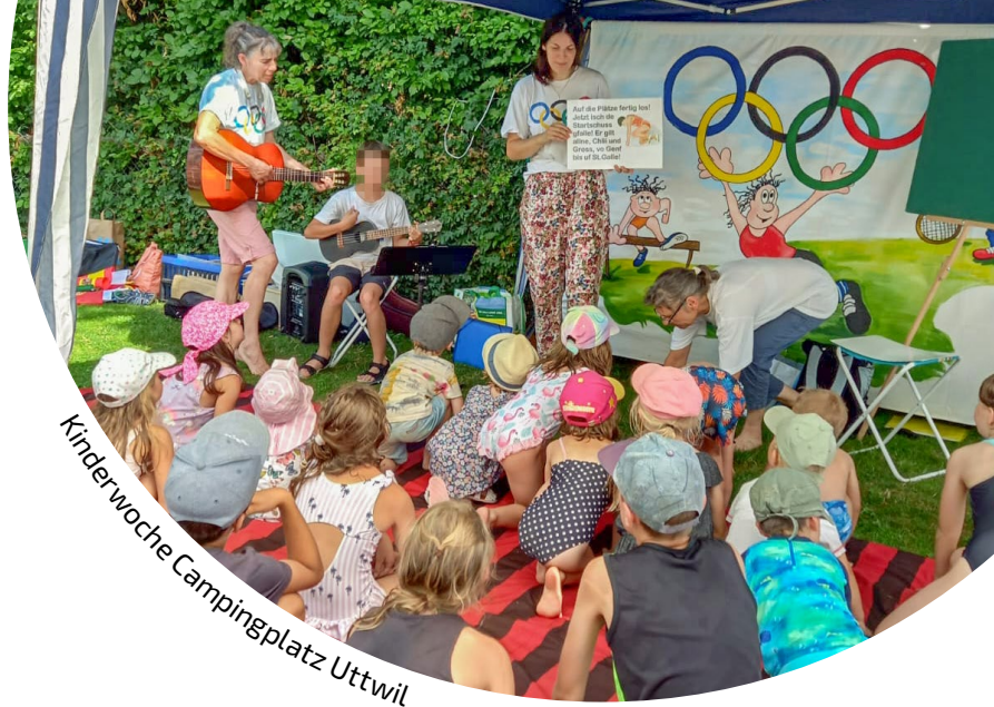
Kinderwoche Campingplatz Uttwil