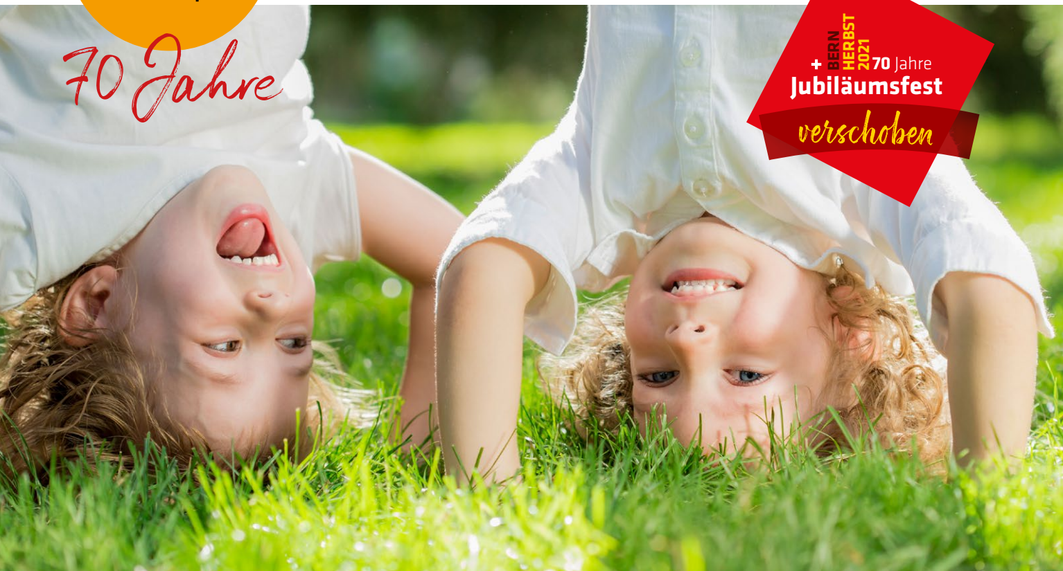
damit Kinder ihr Vertrauen auf Gott setzen!

+ BERN HERBST 2021 70 Jahre Jubiläumfest verschoben